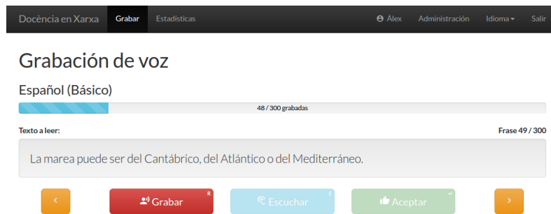
Fig. 1: Interfaz de registro de voz para Docencia en Red

A cada profesor participante se le solicita que registre frases sólo en los idiomas que se considere capaz, con un mínimo de 300 frases en total, a fin de garantizar un cierto grado de calidad, y un máximo de 300 por idioma. Las frases fueron extraídas de forma semi-supervisada de distintas fuentes, tales como diarios, MOOCs o Wikipedia; y editadas si fuera necesario para facilitar su lectura.