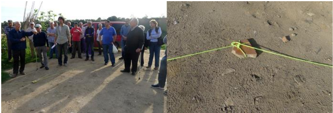
Fig. 5. A cblUYXY`dfcW'g`XY`hUUC`XY`5D`Wb`UWVa i b]XUXYf]UbhgXi fUbhY`dfcnVMc`": i YbhY`7a@=75 mcfX]7UVWCE&S%"

7cbW`mbXcZdcXa cg'XW'f`ei Y YgY`dfcnVMc`dcbYb`Yj ]XbV]UWVa c i bc`XY`cg'fYc'g`ei Yd`Ub`HUY`dUfU]a UXY`Ug'ghb]M]XUX Yg`Y`XYfYW'dYf`Y`dUf]a cb]c`]b]U] [ ]YXY`Ug`[ Yg]C'XY`cg'fYm'g'g'za zg`Uz`XY`dUf]a cb]c`ZgWz`Wa c`Yffla ]YbUdfU`UhfUg`Zefa UjC'g'ghb]M]g'UXY`Ug`W'XUXg'mg`fYUjC'Wb`Y`hff]hfc]"@UX]ZW`HUXUg`a ]! XUZ]W'bhA YbhYb`Ug`X]g'd]bUg`XY`Ufei ]hW'i fUmY`i fVUjga c`XY`bh]fUf`cg'dfcW'g'g'dUf]M]Uj cg'g`Y`Wbj ]YhY`Ug`Yb`i bUcdcfh b]XUXXY`Xchf`U`cg'dfcnVMc`g`Yb`ncbUg`dUf]a cb]Ug`XY`W]hY]cg`g`j Ybh'g`m]j UUXcg`dcf`Y`hYa dc`UdfhUXc`dcf`U`a Ya cf]U`Wa dUf]XUXY`UWVa i b]XUX"